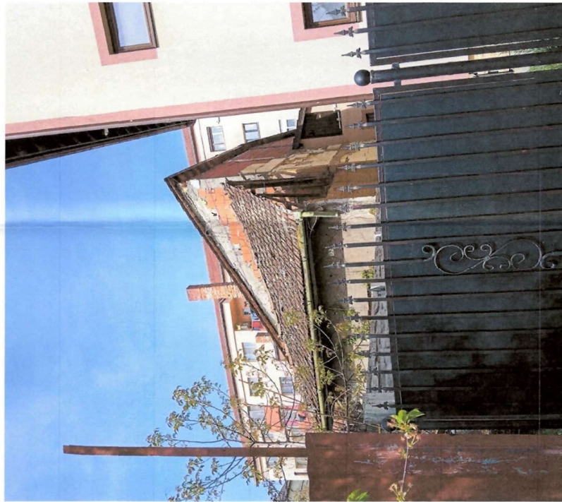
IMAGINI EXTERIOARE SITUATIE EXISTENTA